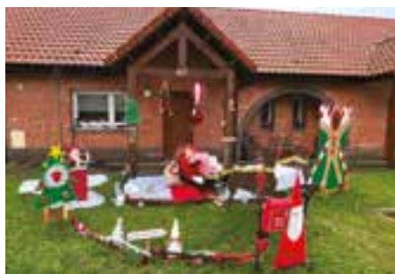
1 er prix « façade de maison » : Fabienne Masurelle