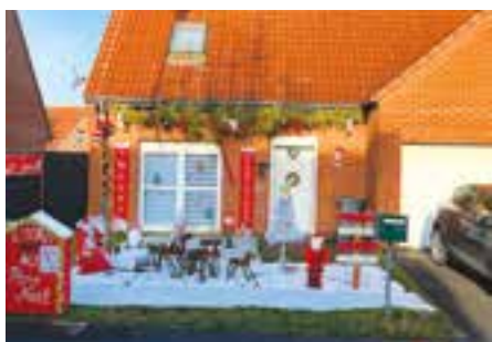
3 ème prix « jardin en front de rue » : Joëlle Morelle