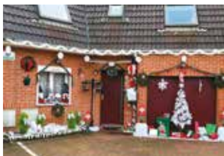
3 ème prix « façade de maison » : Patricia Principi