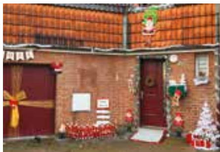
2 ème prix « façade de maison » : Paméla Poradka