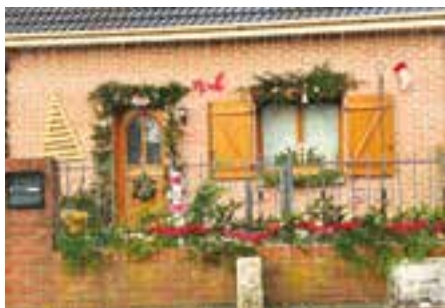
2 ème prix « jardin en front de rue » : Stéphane Decouvelaere